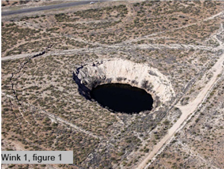
Wink 1, figure 1