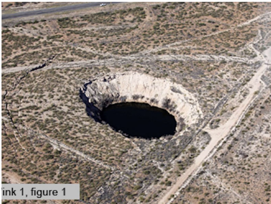
Wink 1, figure 1