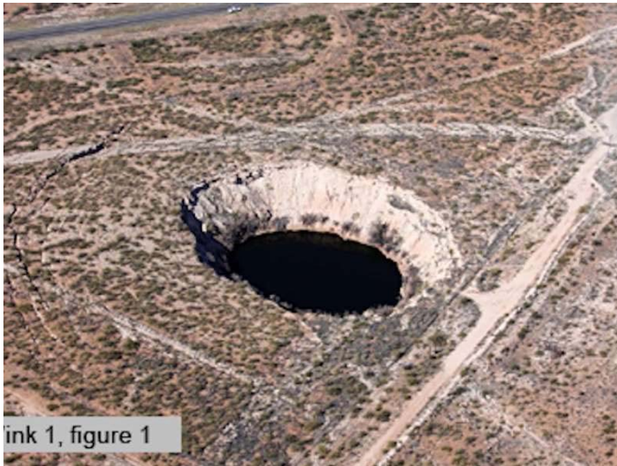
Loch in Texas

1980 hat alles seinen Anfang genommen. In der texanischen Stadt Wink entstanden wie aus dem Nichts binnen kürzester Zeit zwei Löcher. Sie wurden in den darauffolgenden Jahren immer größer, sodass Forscher befürchteten, sie würden zu einem gigantischen Krater verschmelzen.