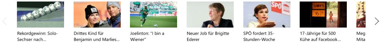
Rekordgewinn: Solo-Sechser nach...